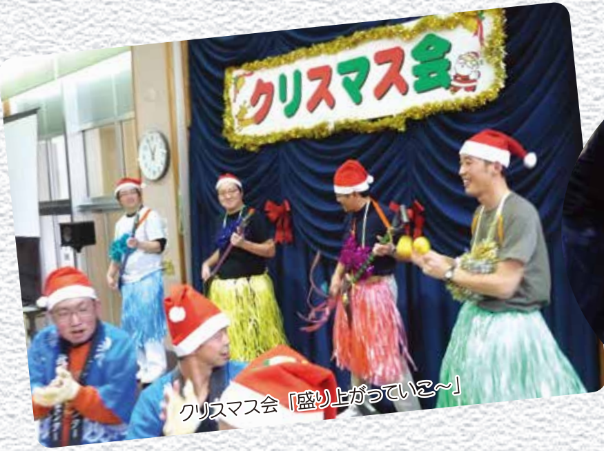
クリスマス会「盛り上がっていき〜」