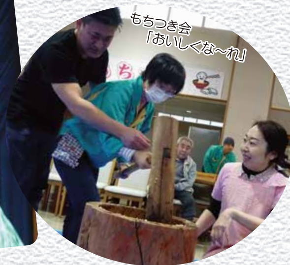
もちつき会「おいしくな〜れ」