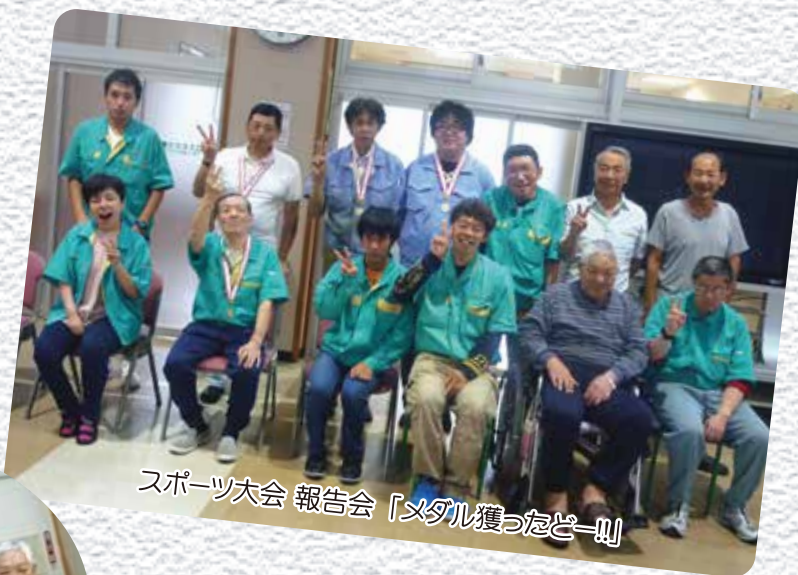
スポーツ大会 報告会「メダル獲ったぞー!!!」