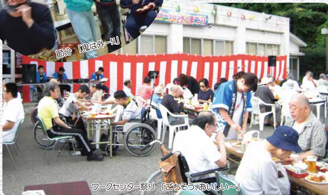
ワークセンター祭り「ごちそう、おいしい〜」